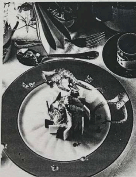
Il Tiramisù secondo la ricetta di Le Cirque, il ristorante di Siro Maccioni a New York.

La storia non è infinita ma quasi e occorre concludere. In mancanza di altri pretendenti (ma gli accenni a Pisa come luogo di importazione del mascarpone lasciano intravedere una possibile candidatura della Toscana), il Tiramisù resterà dunque veneto o un po' anche lombardo? Uno sguardo sia pur fuggitivo alla storia del secolo scorso, proprio a quel Lombardo-Veneto che insieme per decenni visse svantaggi e vantaggi della dominazione e della cultura austroungarica, consente di dividere tranquillamente il dolce a metà. Tranne, ovvio, quando lo si mangia. C